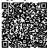
NOVY PRATHYDINA T, SE Ketua TUK